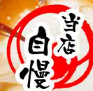
要予約 金目煮付(約40cm) 4,800~