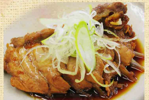
天然まぐろハーモニカ煮付け 480